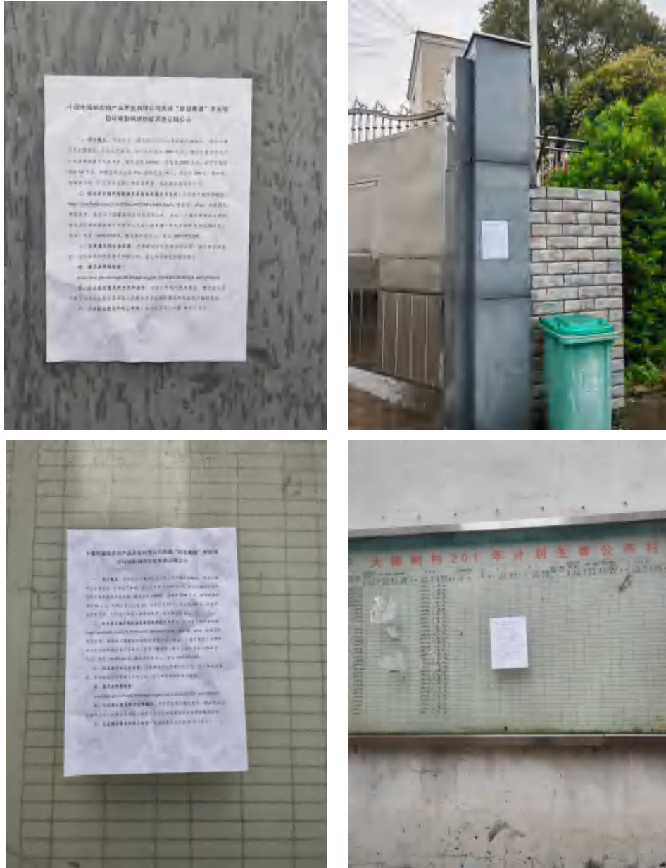
图 3 张贴公示照片

我单位于 2021 年 4 月 2 日在项目所在地附近进行了张贴公示。本次公示张贴地点均为项目周边的敏感点，符合张贴地点的要求。张贴公示照片详见图 3。