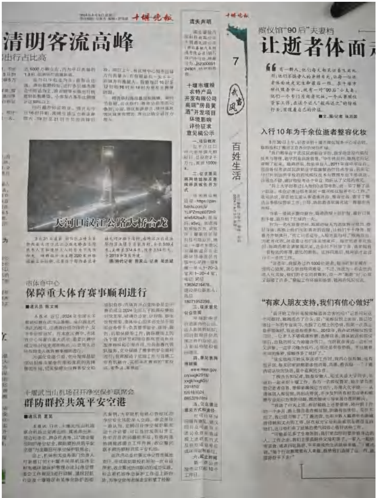
图5 第二次报纸公示 (2024年4月3日)